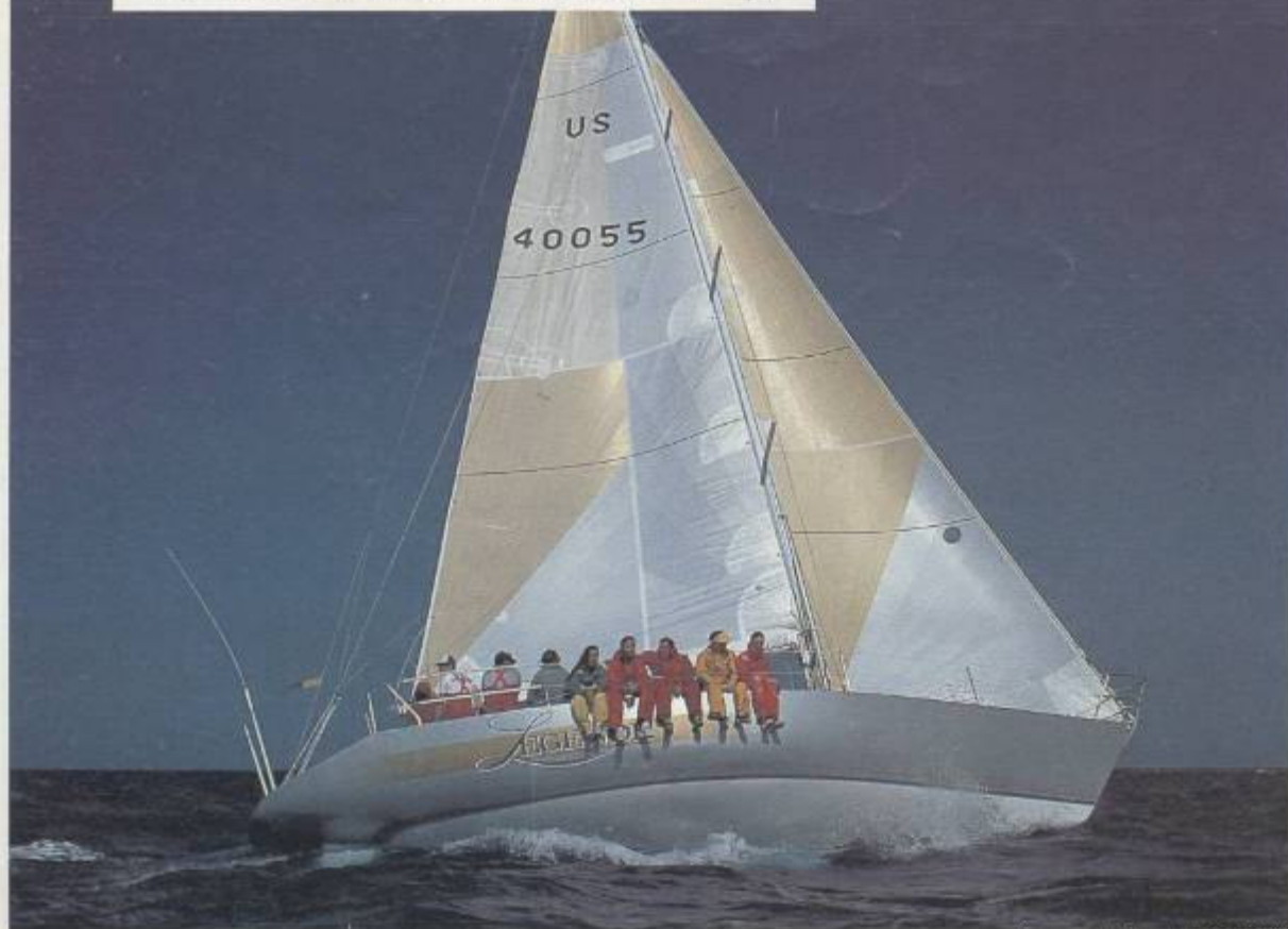
Prototype "Légende," SORC 85