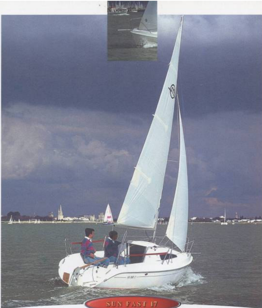
SUN FAST 17